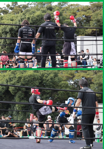
(試合に出る際には応援お願い致します。)